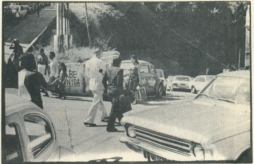
Especuladores batem em retirada