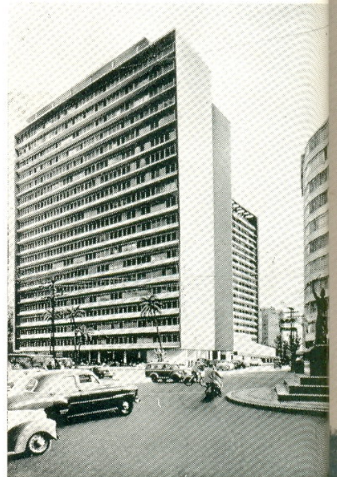
1953 — Edifício "Nações Unidas" à Av. Paulista, Paulo, (em construção). 430 apartamentos, 25 garage p/250 carros, galeria com 6 m de larg playground etc. 63.000 m2 de construção.