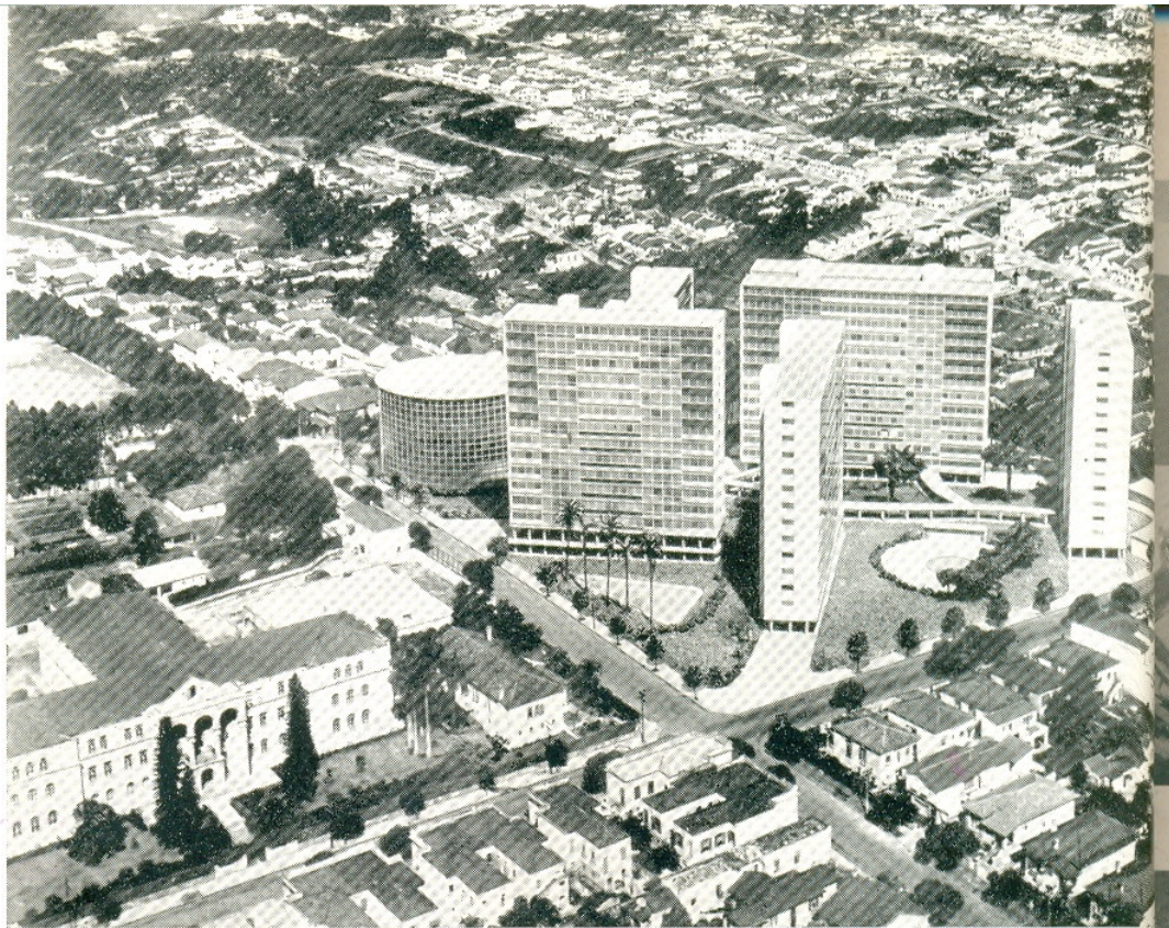
1952 — Conjunto Residencial em Perdizes, São Paulo (em construção).