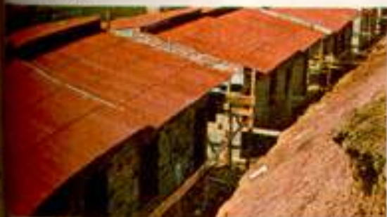
Uma residência construída por MACURI - Miguel Curi financiada pelo B. N. H. O conjunto terá 40 casas

Quando a Brasilit lançou as Chapas Onduladas Economit, nem se falava em Plano Nacional de Habitação. Naquela ocasião, em 1960, fazia falta um tipo de cobertura econômica e durável, de bom aspecto e fácil de instalar. Foi o sucesso de Economit. Você conhece algum outro tipo de cobertura com tantas vantagens? Veja: